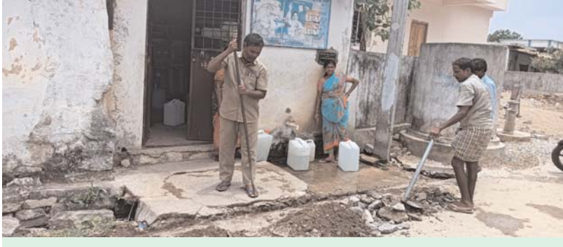
పెన్ హహాడ్ మే 18 ప్రజా సంగ్రామం: