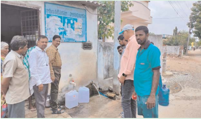
పెన్ హహాడ్ మే 18 ప్రజాసంగ్రామం: